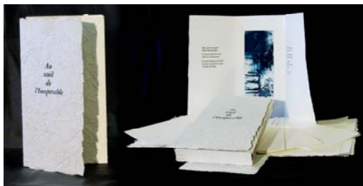
Au seuil de l'Inespérable