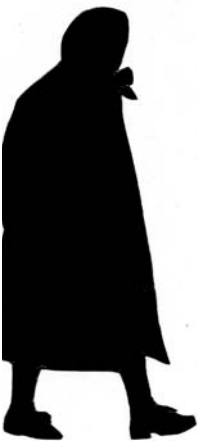
« The Walking Woman » by Michael Snow at 80 = « La femme qui marche » de Michael Snow à 80.